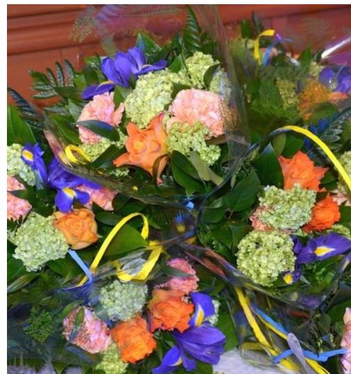
Lämpimät onnittelumme kaikille palkituille ja suuret kiitokset gaalamme osallistuneille!